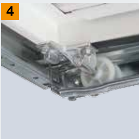
Absetzmulde für Laufrolle

Möchten Sie mehr Sicherheit? Dann wenden Sie sich an Ihren Hörmann Fachhändler!